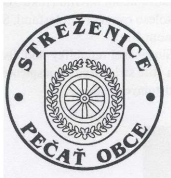
Obecná pečať s kruhopisom

Pečať obce je okrúhla, uprostred s obecným symbolom a kruhopisom OBEC STREŽENICE s priemerom 35mm.