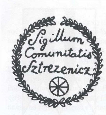
Historická obecná pečať Streženíc

Najstaršia zachovaná obecná pečať nemá datovanie. Použitá bola v roku 1860. Priemer pečate je 30 mm. V dolnej časti pečatného poľa je malé koleso voza, nad tým je kurzívou v troch riadkoch legenda: Sigillum Comunitatis Sztrezenicz . Vonkajší okraj pečate tvorí široká listovka. Odtlačok nedatovaného typára je uložený v Ústrednom archíve geodézie a kartografie v Bratislave.